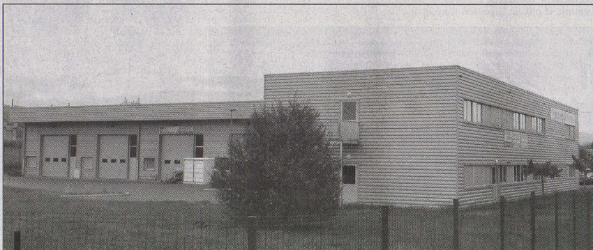
Opérationnel et ouvert aux utilisateurs depuis le 1er mars dernier, le télécentre "l'Espélib" est implanté dans les locaux de la pépinière d'entreprises l'Espélibidou à Lachapelle-sous-Aubenas. Aménagé par le Sympam dans un des bureaux initialement dédié aux créateurs d'entreprises, "l'Espélib" propose tous les services dont a besoin un télétravailleur pour mener son activité.