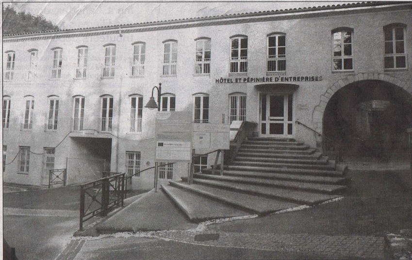
Réaménagée en pépinière d'entreprises par la Communauté de communes du bassin d'Annonay, l'ancienne manufacture royale de Vidalon fait partie du réseau de télécentres que souhaite mettre en place le Conseil général de l'Ardèche.

En ce sens, et quand bien même les données concernant le nombre de télétravailleurs - en activité et/ou potentiels sont floues et nécessiteraient d'être finalisées, la création et l'animation d'un réseau de télécentres en Ardèche constitue une réponse particulièrement pertinente estime le Conseil général puisqu'elle vise à apporter une solution à toutes les nouvelles formes de travail que sont les salariés télétravailleurs, les indépendants, les travailleurs