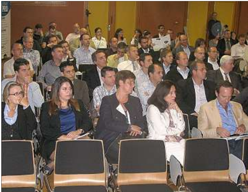
200 entreprises tournées vers le numérique et une économie durable gravitent autour de Rhône Alley.